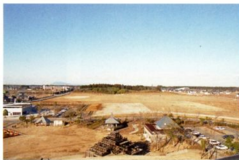
たつのこ山より松ヶ丘方向を望む（平成 10 年）