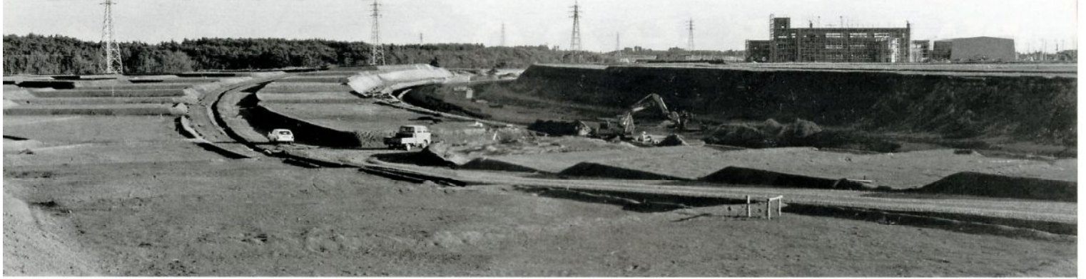
ニュータウン造成 若柴公園付近より松葉小学校を望む(昭和56年)