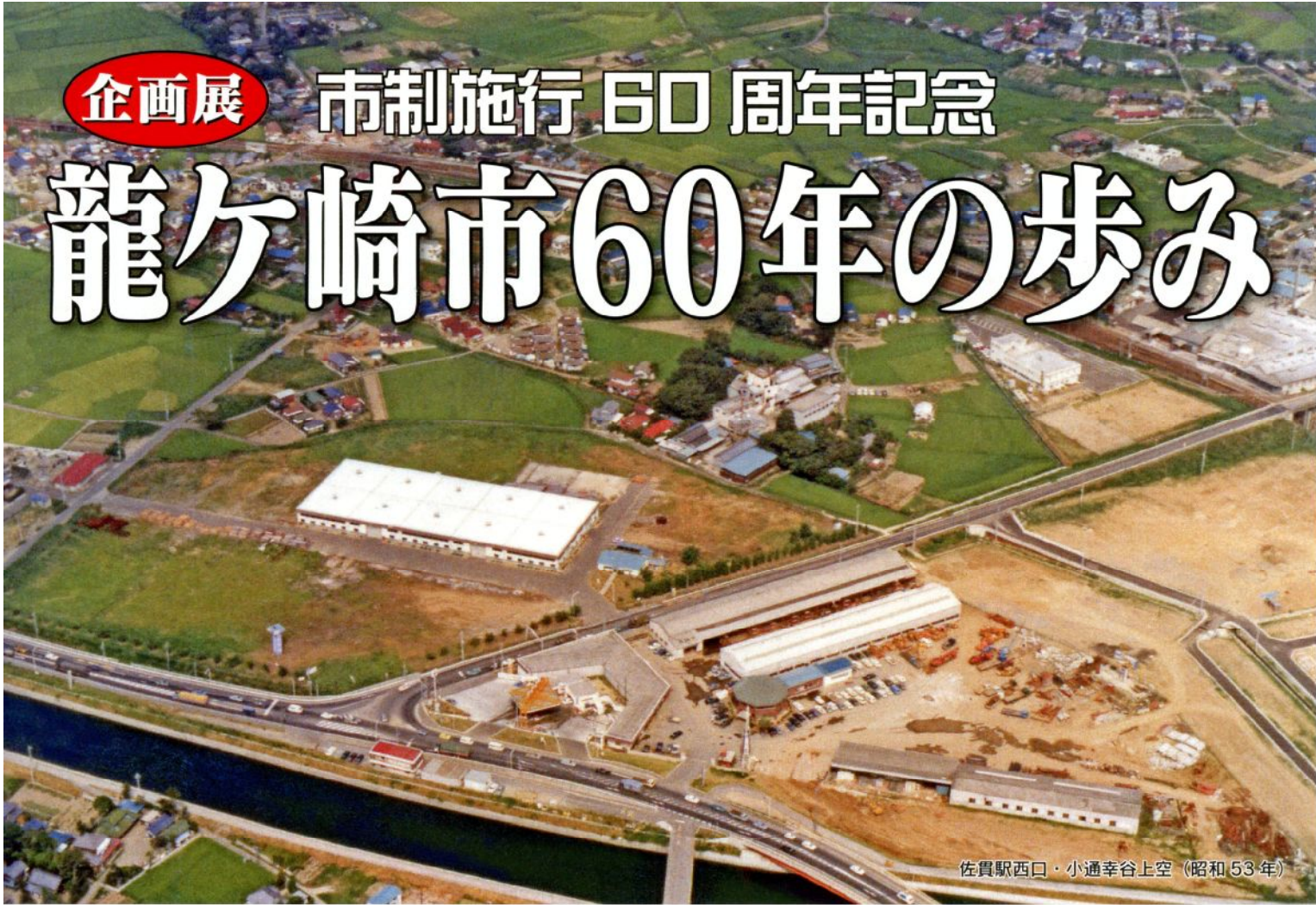
佐貫駅西口・小通幸谷上空（昭和 53 年）