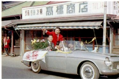
岡野功選手東京オリンピック優勝（昭和 39 年）