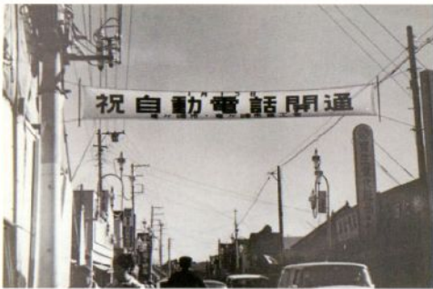
自動電話開通の横断幕（昭和 41 年）