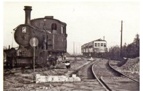
S L からディーゼル機関車へ（昭和 40 年）