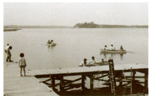
牛久沼のボート乗り場（昭和 43 年）