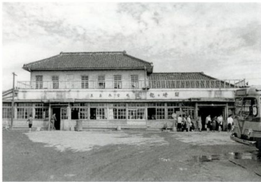
龍ヶ崎駅 (昭和34年頃)