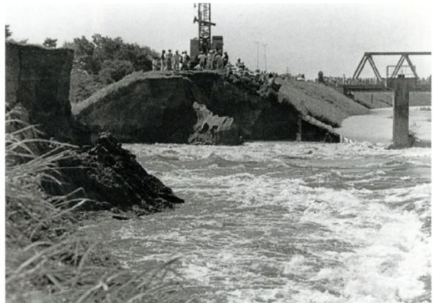
小貝川決壊(昭和56年)

昭和29年(1954)3月20日、龍ヶ崎町と隣接する6か村(大宮・長戸・八原・馴柴・川原代・北文間)が合併し、龍ヶ崎市が誕生しました。人口約34,500人で出発した小さな町は、60年の間に大きな発展を遂げ、現在は、約79,500人が暮らす都市へと成長しました。