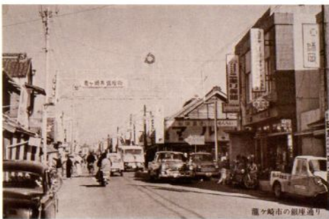
上町交差点（昭和 38 年頃）