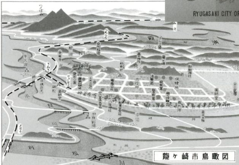
市鳥瞰図(昭和38年頃)