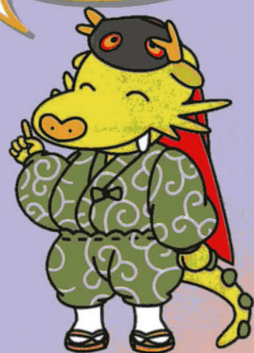
龍ヶ崎市マスコットキャラクター まいりゅう

今回の展示では 12 名の先人を紹介しています。ほかにも龍ヶ崎に貢献されたたくさんの先人がいます。調べてみましょう。