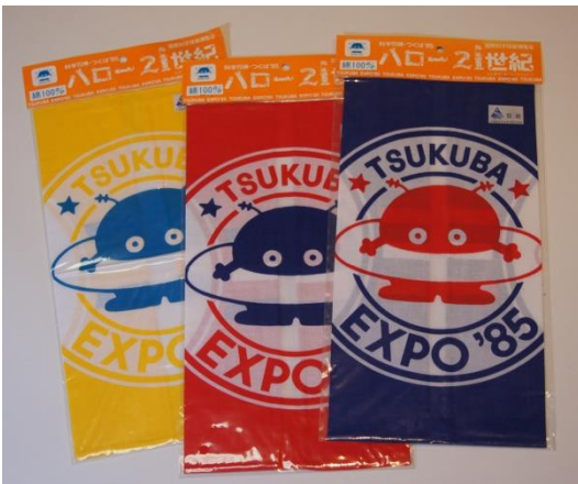
コスモ星丸ハンカチ