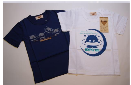
コスモ星丸Tシャツ