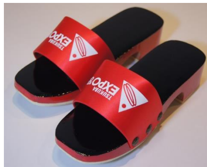
シンボルマーク入りサンダル下駄