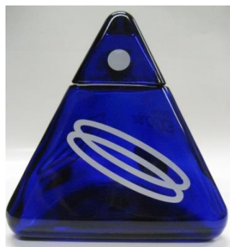
シンボルマーク型酒瓶