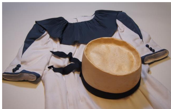
東芝館コンパニオン夏服