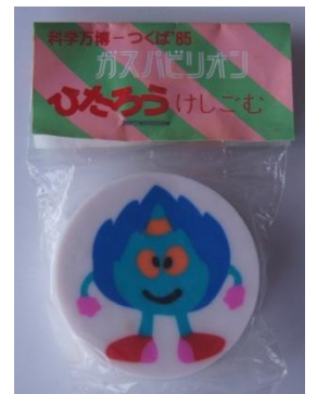
ガスパビリオン消しゴム

昭和60年（1985）、筑波研究学園都市（現つくば市）で開催された「科学万博—つくば’85」は、昭和45年（1970）の大阪万博、昭和50年（1975）の沖縄海洋博に次いで、我が国で3番目に開催された万国博覧会でした。21世紀の科学技術に関する世界的な大事業が身近な場所で行われるということに、当時の茨城県内は大きな盛り上がりを見せ、われわれ龍ヶ崎市民の多くも、未来の世界を体験しようと会場に足を運びました。来場者や関係者が手にした様々な記念グッズは、人々の思い出の品となっていました。当館が平成22年に行った科学万博25周年記念展を機に寄贈者が増え、収蔵資料が増加しました。