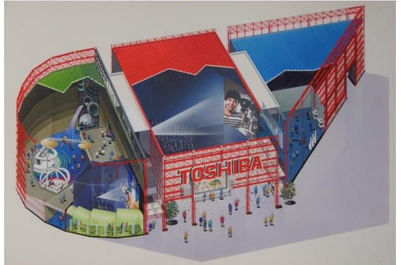
東芝館完成予想イラスト