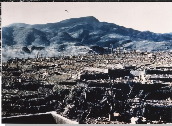
上：廃墟の浦上天主堂